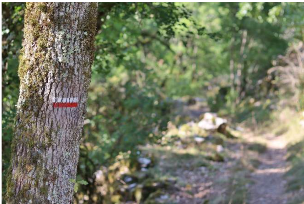
Sur le GR

L'itinéraire de la Voie de Rocamadour propose après Rocamadour 2 variantes . L'une continue sur le GR@652 en direction du Vigan, l'autre continue sur le GR@46 en direction de Labastide-Murat