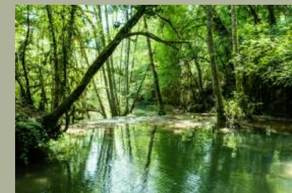
Ruisseau du Vers