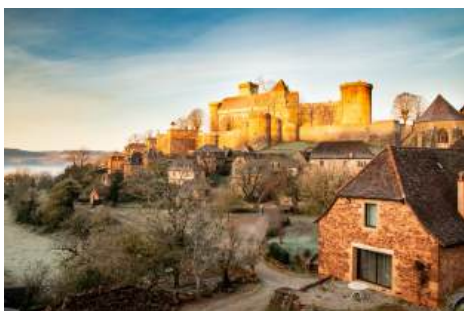
Château de Castelnau-Bretenoux

La bastide de Bretenoux, située sur les rives de la Cère et de la Dordogne dans le Lot, a été fondée au XIII e siècle par Guérin de Castelnau. Son plan, typique des bastides, s'organise autour d'une place pavée de galets qui s'anime les jours de marché. Les vestiges des remparts, dont la porte de la Guierle, et les maisons des XV e au XVIII e siècles témoignent de son riche passé. À proximité, l'île de la Bourgnatelle offre un espace paisible pour les promeneurs et pêcheurs. Non loin de là, vous pouvez visiter le Château de Castelnau-Bretenoux situé à Prudhomat, château fort des barons de Castelnau.