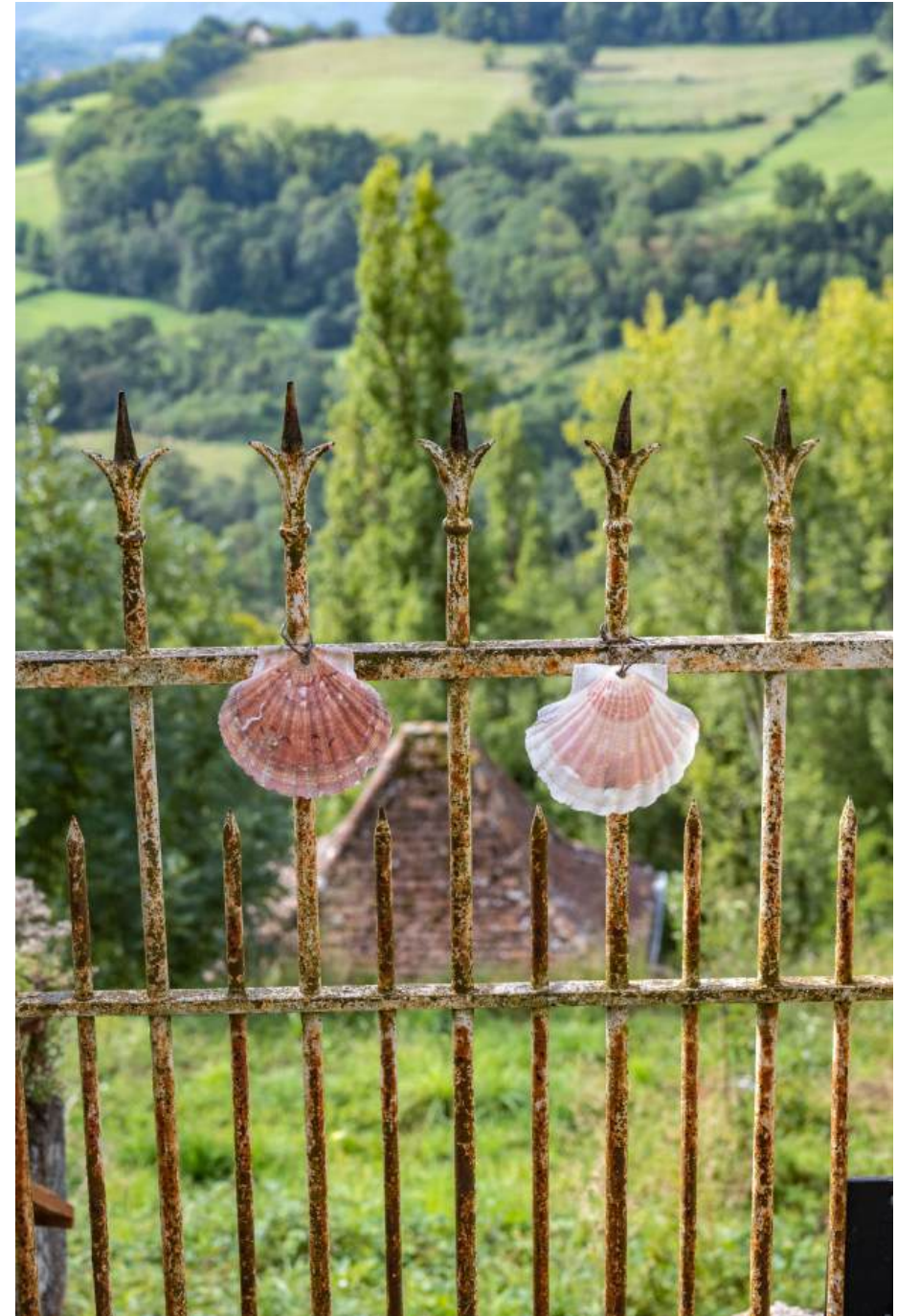
Sur le chemin de Saint-Jacques