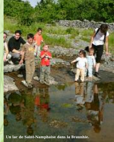
Un lac de Saint-Namphaise dans la Braunhie.